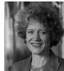
Corine Mauch Stadtpräsidentin

Corine Mauch Stadtpräsidentin von Zürich